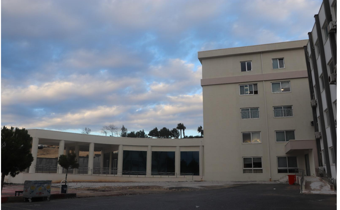
Fotoğraf 3) Tarsus Üniversitesi Merkezi Derslik ve İdari Birimler Binası