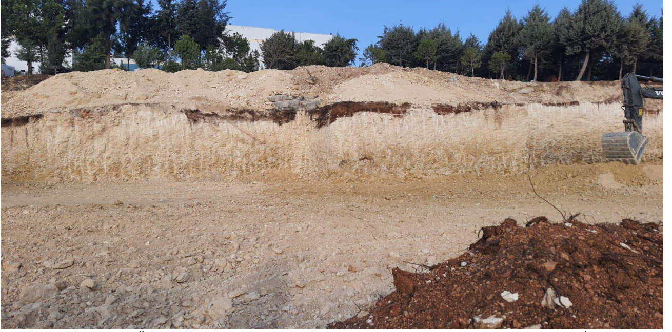
Fotoğraf 10) Tarsus Üniversitesi Yabancı Diller Hazırlık Sınıfları Derslik Binası Yapım İşi

Üniversitemiz yerleşkesinde 27.10.2021 tarihinde yapımına başlanan Tarsus Üniversitesi Yabancı Diller Hazırlık Sınıfları Derslik Binası Yapım İşinin sözleşme bedeli 13.699.000,00 TL. Yapım işinin % 1'i tamamlanmıştır.