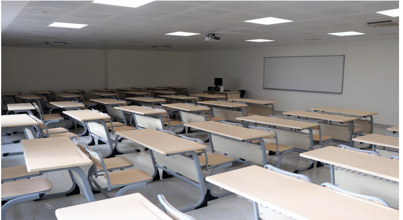
Fotoğraf 5) Tarsus Üniversitesi Merkezi Derslik ve İdari Birimler Binası