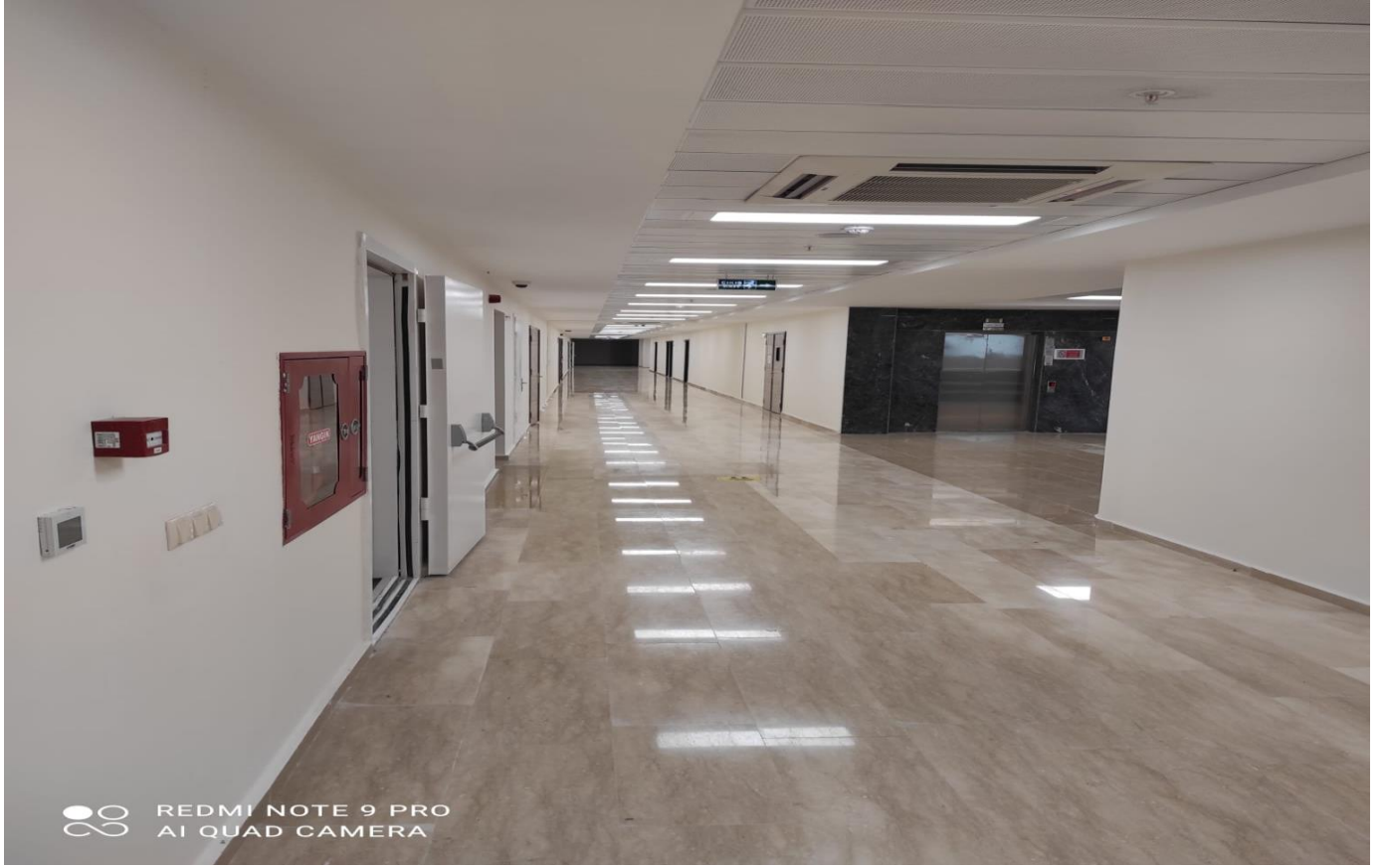
Fotoğraf 2) Tarsus Üniversitesi Merkezi Derslik ve İdari Birimler Binası