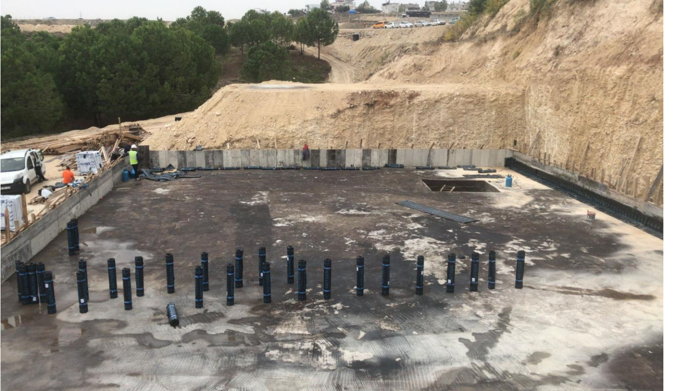
Fotoğraf 11) Tarsus Üniversitesi Yabancı Diller Hazırlık Sınıfları Derslik Binası Yapım İşi