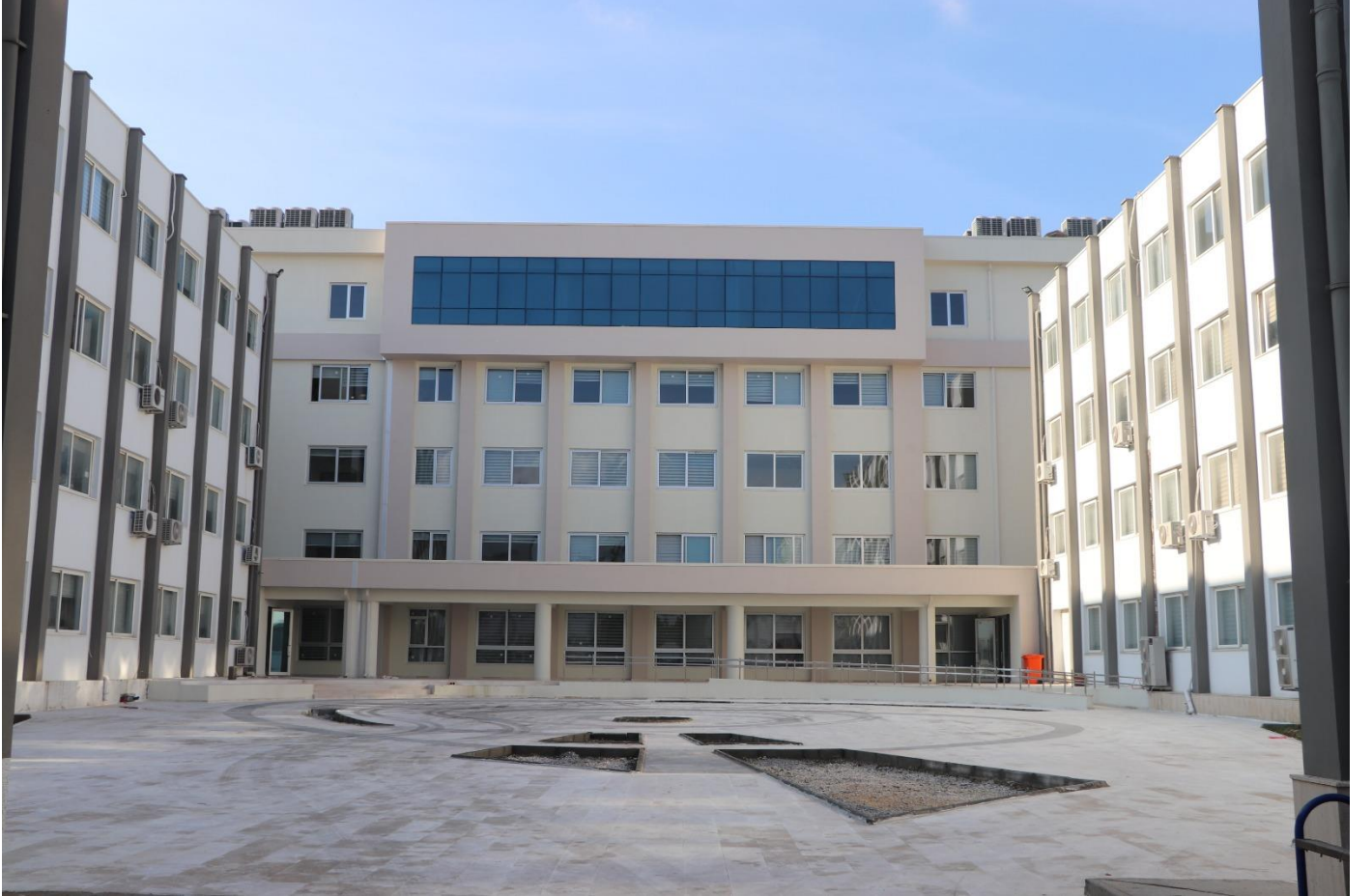
Fotoğraf 1) Tarsus Üniversitesi Merkezi Derslik ve İdari Birimler Binası

Üniversitemiz yerleşkesinde 29.01.2020 tarihinde yapımına başlanmış olup, 24.09.2021 tarihinde tamamlanmıştır. Tarsus Üniversitesi Merkezi Derslik ve İdari Birimler Binası yapım işinin sözleşme bedeli 15.361.000,00 TL. Yapım işinin % 100'ü tamamlanmıştır.